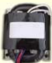
先進のR-コアトランス

オーディオ機器として重要な電源トランスには超低リーケージフラックス、低損失過負荷特性に優れた先進の「R-コアトランス」を採用し、SNの大幅な改善とクリアな音質を約束します。