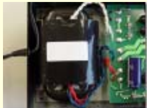
高性能R-コア電源トランス

以前の同クラスモデルよりも大型の出力トランスを採用。余裕のある音を約束します。 電源トランスは定評のある高性能トランス、R-コアを採用。 トランスの次に音質に影響を与えるコンデンサにもこだわりました。カップリングコンデンサにはポリプロピレンフィルムコンデンサ(従来はポリエチレンフィルム)を、また電解コンデンサはすべて低ESR品を採用し、過渡特性の向上を図っています。